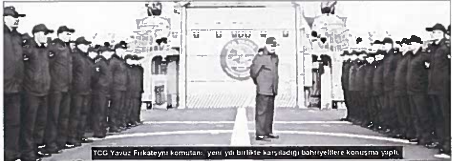
TCG Yavuz Firkateyni komutanı, yeni yılı birlikte karşıladığı bahriyelilere konuşma yaptı.

getiriyoruz. Egemenlik haklarımızı korumak adına görevimizi yapmaya devam ediyoruz. Küçük bir kartalın var benim. Ondan uzaklaşam ama burada da ailemle beraberim. Gemideki aile olarak yapacağız bir iş. Aile olmadan becerebilecek bir meslek değil. Gemideki herkes ailenin bir parçası. O yüzden ailemizden uzaktaki değiliz. Aslında iç içe, birlikteyiz."