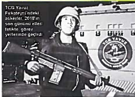
TCG Yavuz Firkateyni'ndeki askerler, 2018'in son gününü elleri tutukta görev yerlerinde geçirdi.

Sevizi elektronik astsubayı da TCG Yavuz Firkateyni'nde görev yapmaktadır. Onun ve mutluluk duyduğuna söyledi. Geminde nite gibi olduklarını anlatan astsubayı, şöyle dedi: "Bizim için yeni yılın sonu günü diğer günlerden farklı ve görevimizin başındayız. Komutanımız yeni yılını kutladı. Biz gururluyuz. Vatanımızın, milletimizin bize verdiği görev var ve biz onu yerine