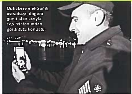
Muhabere elektronik astsubayı doğum günü olan kızıyla cep telefonundan görüntülü konuştu.